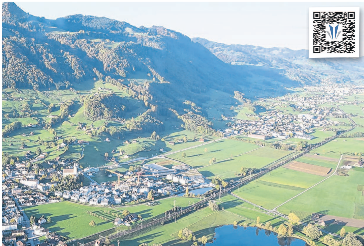
Soll auf dem Gebiet zwischen Buttikon und Reichenburg ein Arbeitsplatzgebiet entstehen? Aktuell läuft eine Testplanung.

Die Verantwortlichen der Standortgemeinden Schübelbach und Reichenburg und des Kantons laden die Bevölkerung zu einer öffentlichen Veranstaltung ein, an der an verschiedenen Posten die Resultate der Testplanung vorgestellt werden. Die Veranstaltung findet am Montag, 2. Dezember, um 19.30 Uhr, in der Mehrfachturnhalle Gutenbrunnen in