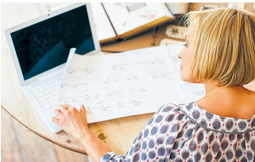
Das neue Anwendungsprogramm soll auch neue Mitglieder anlocken.

die Zusammenarbeit an gemeinsamen Projekten fördert. Dies eröffnet neue Perspektiven und ermöglicht es, gemeinsam an der Aufdeckung von Familiengeschichten zu arbeiten, die möglicherweise über Generationen hinweg verloren gegangen sind.